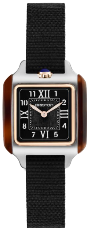
HM Quartz Suisse 252025.PRA.T.1.NB NOUVEAUTES MAI 2025