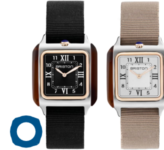
STREAMLINER Kennedy HM Moyen Modèle (30x30mm) Boîtier en acier & PVD or rose & acétate écaille de tortue Bracelet NATO 450€