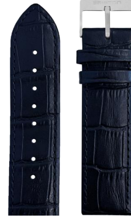
Cuir Alligator Bleu marine Boucle acier L20.ANV 70€