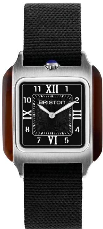
HM Quartz Suisse 252030.SA.T.1.NB NOUVEAUTES MAI 2025