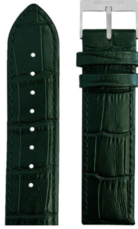
Cuir Alligator Vert Anglais Boucle acier L20.ABG 70€