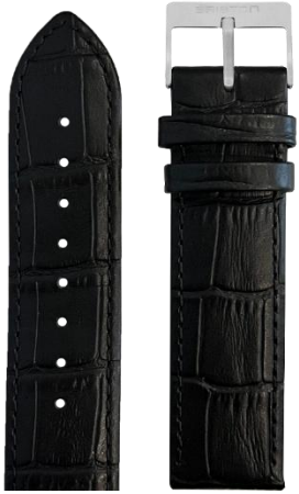
Cuir Alligator noir Boucle acier L20.AB 70€

Nouveaux bracelets traditionnels en deux brins cuir de vachette imitation alligator et équipés du système presto (pompes avec ressort) pour le retirer Boucle ardillon en acier poli avec gravure BRISTON Interchangeable et adaptable à tous nos modèles Clubmaster & Streamliner Kennedy avec entre cornes 20mm Longueur: 75 / 115mm - Largeur: 20mm Disponible à partir d'avril 2025