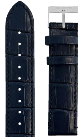
Cuir Alligator Bleu marine Boucle acier L18.ANV 70€