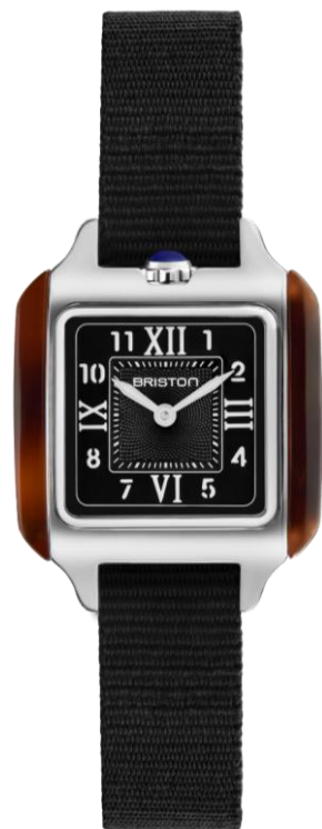
HM Quartz Suisse 252025.SA.T.1.NB NOUVEAUTES MAI 2025