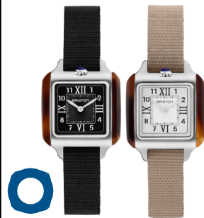
STREAMLINER Kennedy HM Petit Modèle (25x25mm) Boîtier en acier & acétate écaille de tortue Bracelet NATO 370€