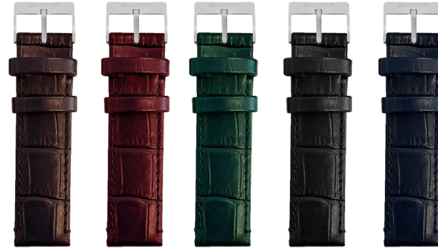
Bracelets en cuir imitation alligator 70/115mm – 18mm - 5 références