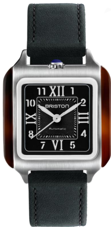
HMS Automatique 251936.SA.T.1.CH