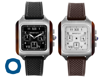
STREAMLINER Kennedy Chronographe Petite Seconde (38,5x38,5mm) Boîtier en acier & acétate écaille de tortue Bracelets en caoutchouc FKM 500€