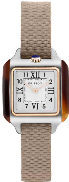
HM Quartz Suisse 252025.PRA.T.2.NT NOUVEAUTES MAI 2025