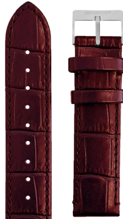
Cuir Alligator Bordeaux Boucle acier L18.ABDX 70€