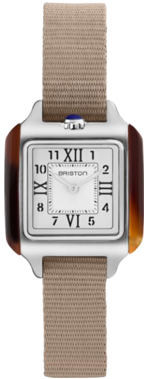
HM Quartz Suisse 252025.SA.T.2.NT NOUVEAUTES MAI 2025