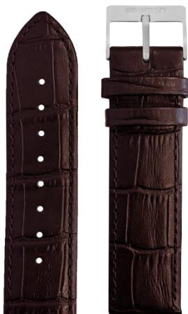
Cuir Alligator MARRON Boucle acier L20.ABR 70€