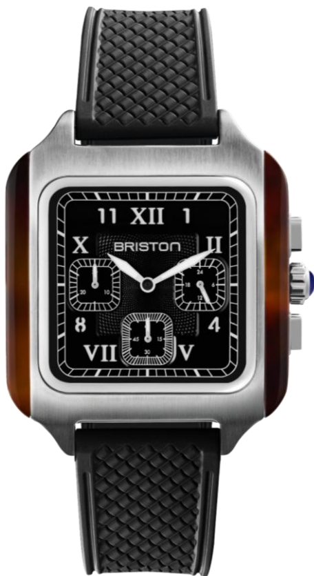
Chronographe Petite Seconde 251838.SA.T.1.FB NOUVEAUTES MAI 2025