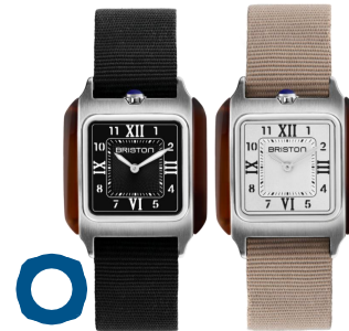
STREAMLINER Kennedy HM Moyen Modèle (30x30mm) Boîtier en acier & acétate écaille de tortue Bracelet NATO 420€