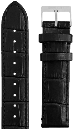
Cuir Alligator noir Boucle acier L18.AB 70€

Nouveaux bracelets deux brins en cuir de vachette imitation alligator équipés du système presto (pompes avec ressort) pour le retirer Boucle ardillon en acier avec gravure BRISTON Interchangeable et adaptable aux modèles Clubmaster & Streamliner Kennedy avec entre cornes 18mm Longueur: 70 / 115mm - Largeur: 18mm Disponible à partir de mai 2025