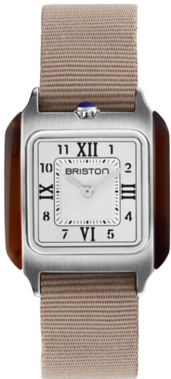
HM Quartz Suisse 252030.SA.T.2.NT NOUVEAUTES MAI 2025