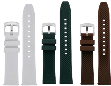
Bracelets en caoutchouc FKM 75/115mm – 20mm - 3 références