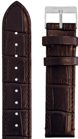
Cuir Alligator MARRON Boucle acier L18.ABR 70€