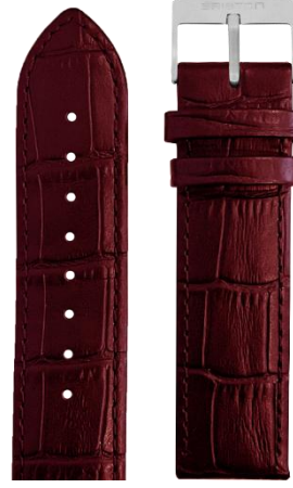
Cuir Alligator Bordeaux Boucle acier L20.ABDX 70€