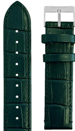
Cuir Alligator Vert Anglais Boucle acier L18.ABG 70€