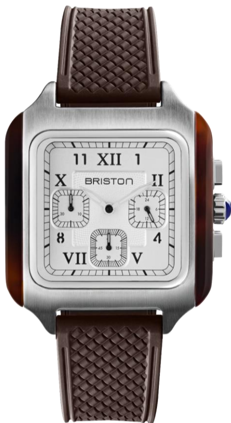
Chronographe Petite Seconde 251838.SA.T.2.FBR NOUVEAUTES MAI 2025