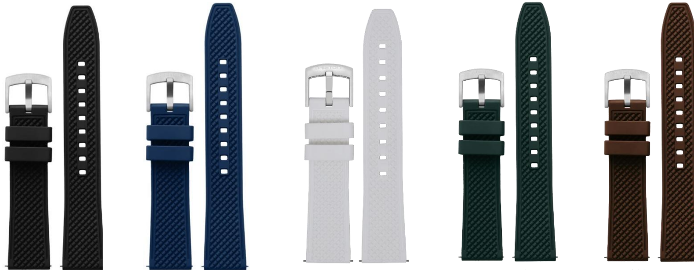
NOIR Boucle en acier RF20.B 60€