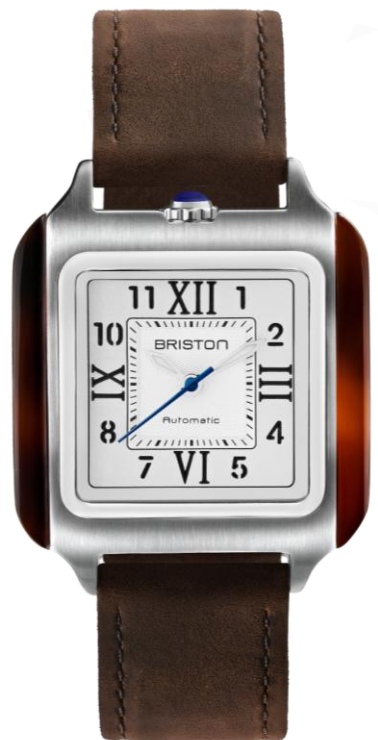
HMS Automatique 251936.SA.T.2.C