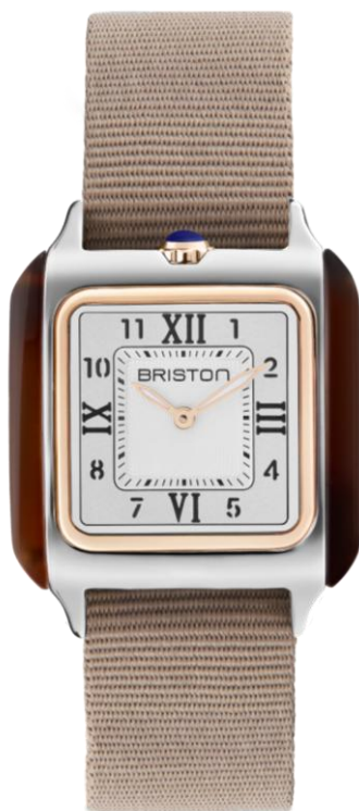
HM Quartz Suisse 252030.PRA.T.2.NT NOUVEAUTES MAI 2025