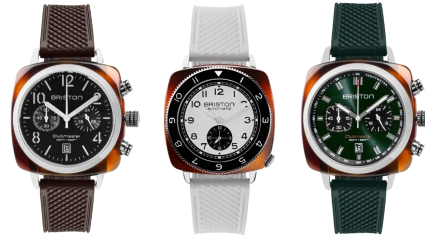
MARRON Boucle en acier RF20.BR 60€