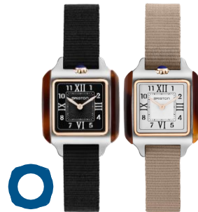
STREAMLINER Kennedy HM Petit Modèle (25x25mm) Boîtier en acier PVD or rose & acétate écaille de tortue Bracelet NATO 400€