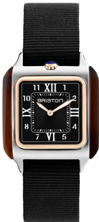
HM Quartz Suisse 252030.PRA.T.1.NB NOUVEAUTES MAI 2025